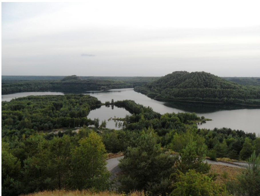
Begin juli bracht Dirk de slobkousjes naar Connectera en liet ze genieten van dit landschap