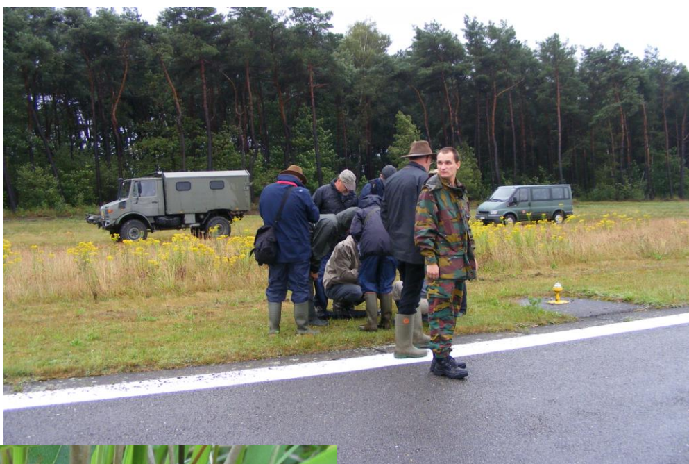
Op 9 juli hielden de slobkousjes manoeuvres op de basis van Kleine Brogel