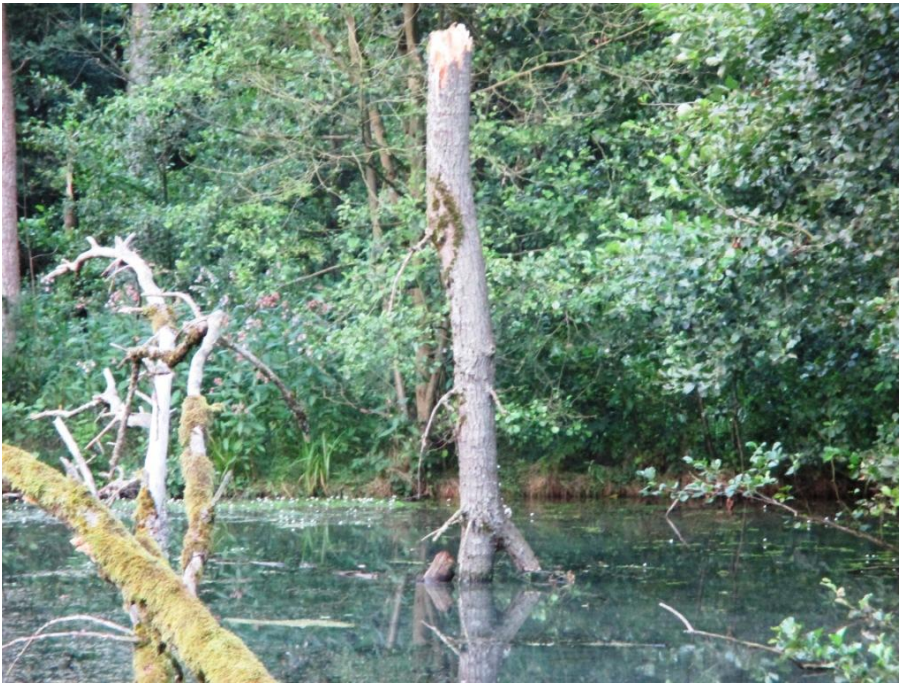
Eind juli een wandeling door de natte boorden van de Dommelvallei waar de bomen ondersteboven lijken te groeien.