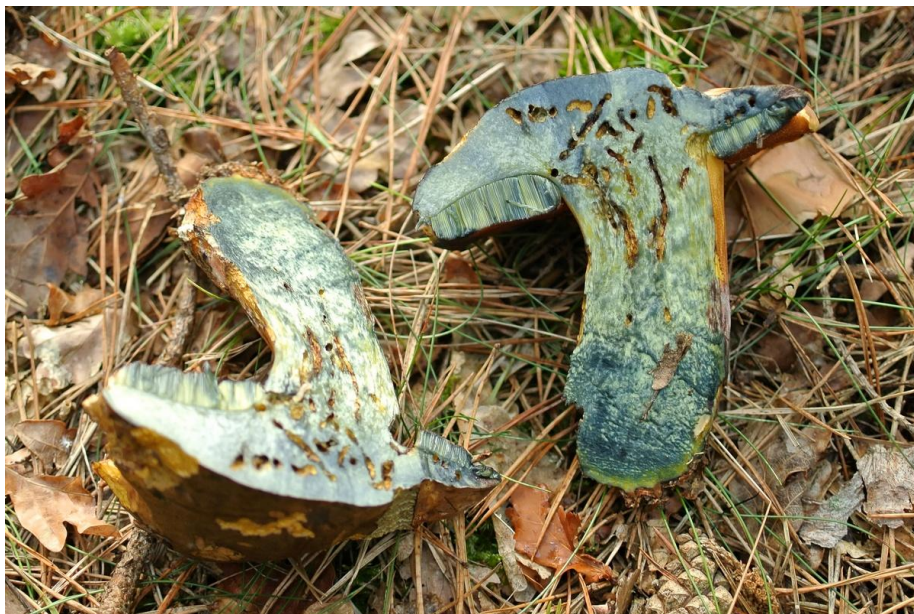
Midden september was het terug tijd om naar de paddenstoelen te kijken. We deden dissectie op deze heksenboleet.