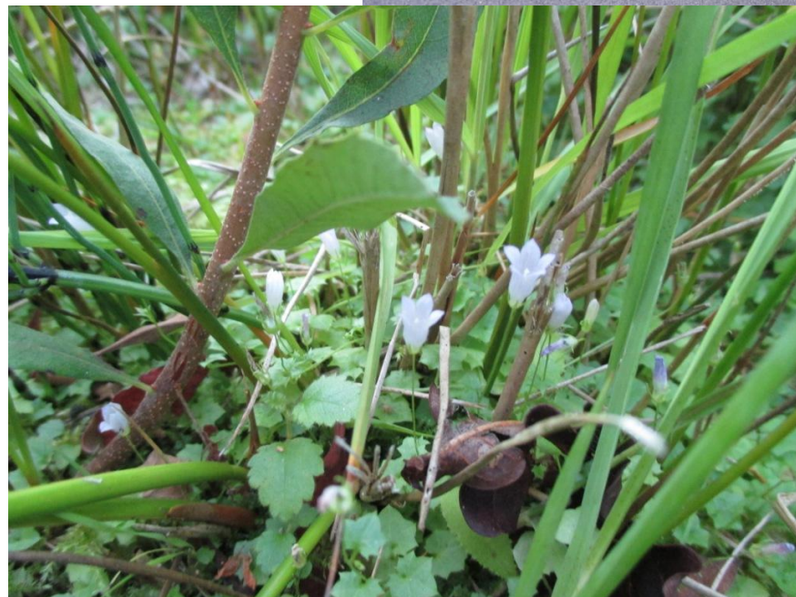
Op 23 juli werden we in het buitengoor vertederd door het klimopklokje