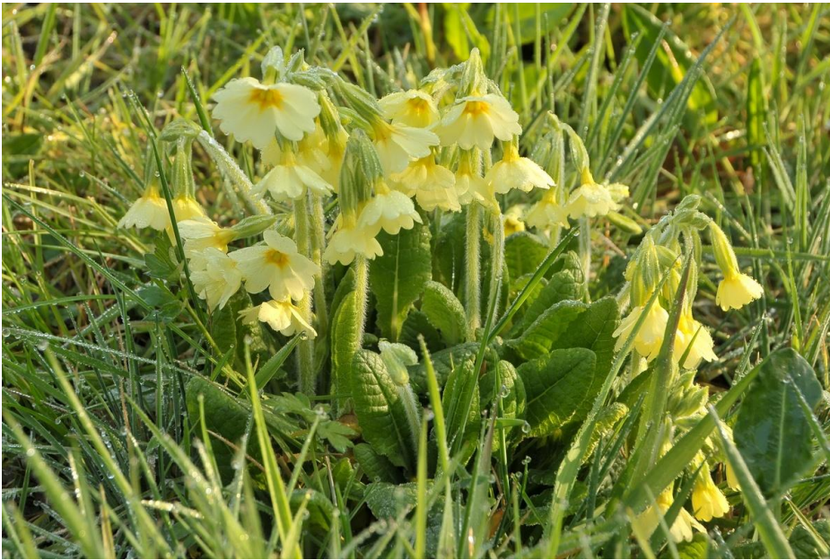
De laatste dinsdag van maart lachten de slanke sleutelbloemen ons al toe.