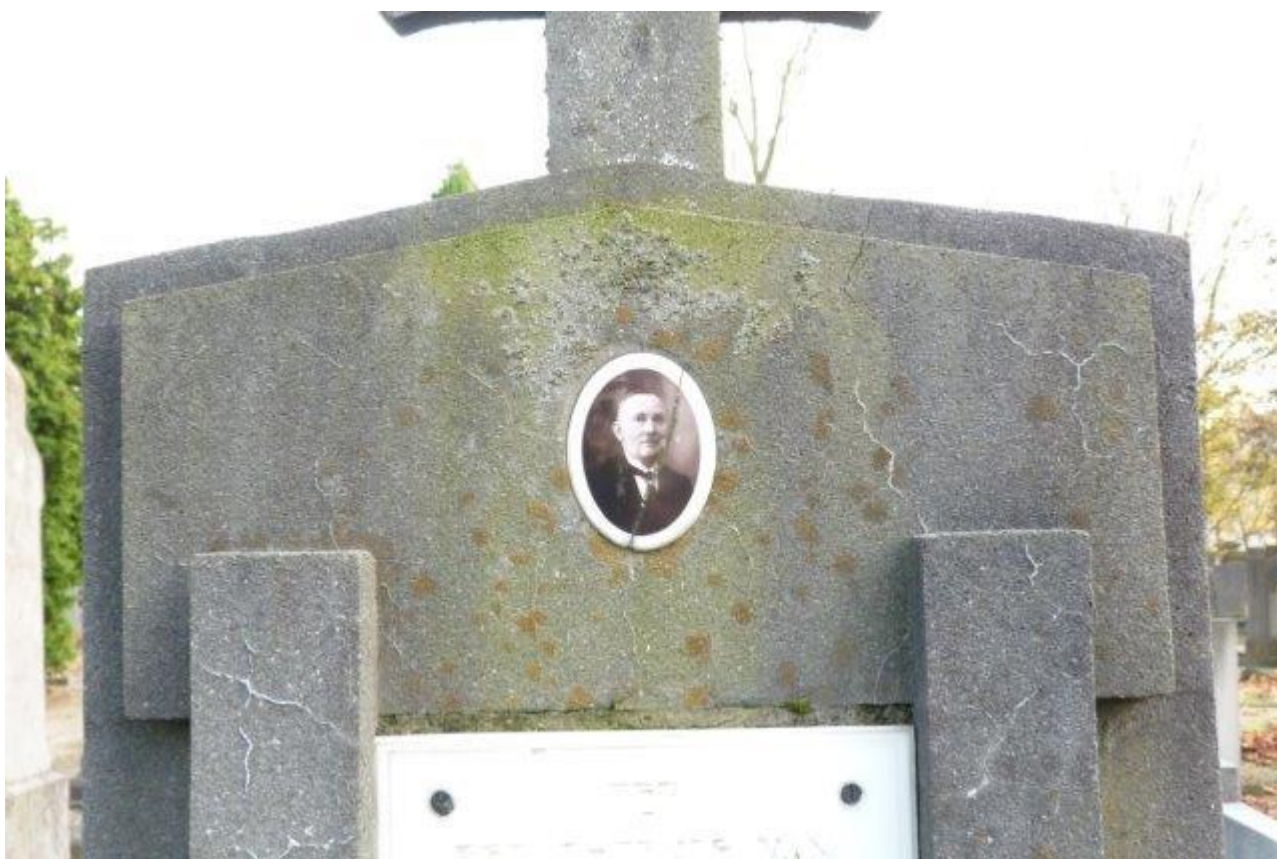
De oude begraafplaatsen werden nu onze pleisterplaats