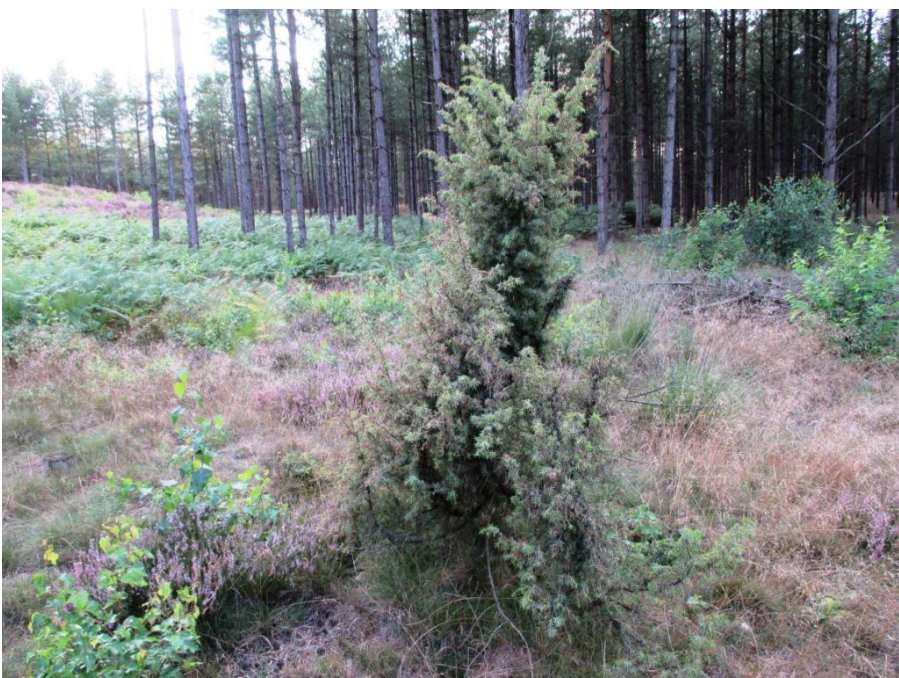
Deze jeneverbes mag in dit rijtje natuurlijk niet ontbreken.