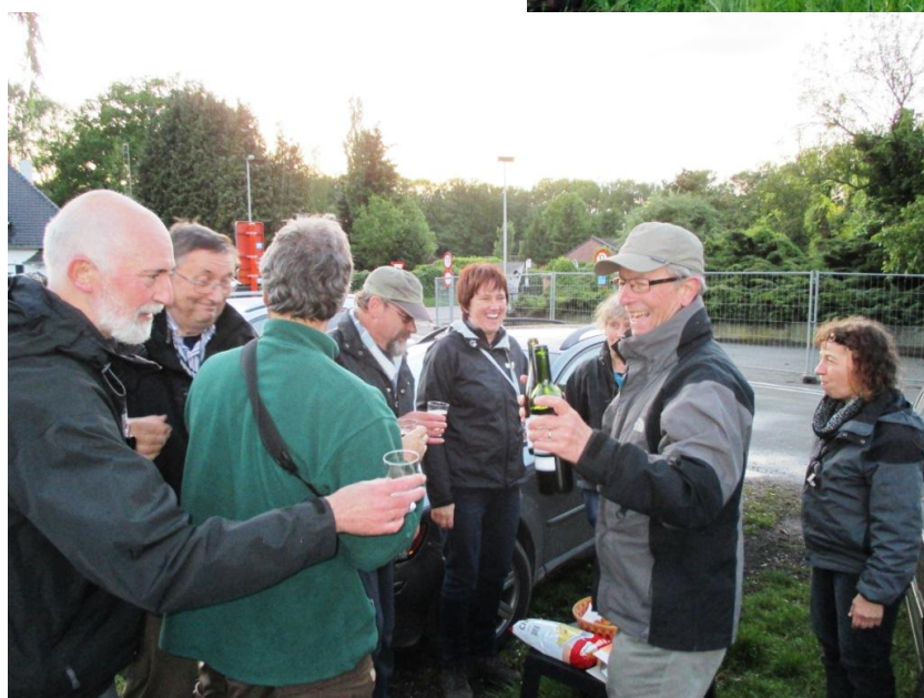
Op 14 mei waren we te gast bij onze vrienden van het SAP clubje en die weten duidelijk wat gastvrijheid is.