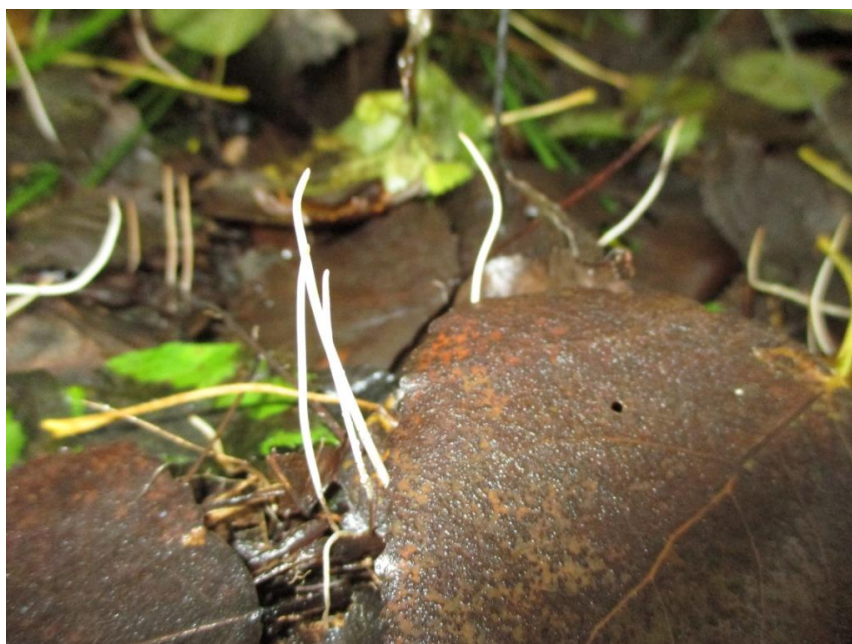
Wie oog heeft voor het kleine zag in Mullemerbemde deze draadknotszwammetjes