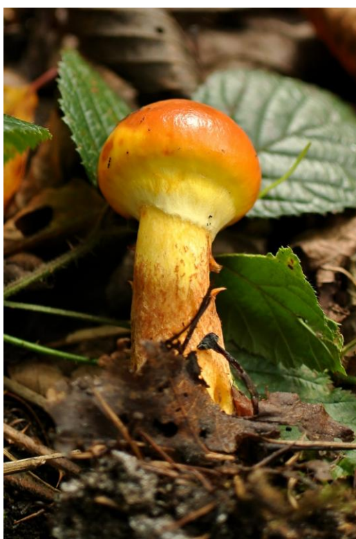
Deze gele ringboleet stond sierlijk te wezen in de omgeving van het Venlokaal