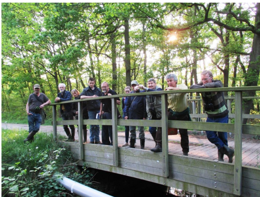
Op 30 april vonden ze dat een groepsfoto niet mocht ontbreken.