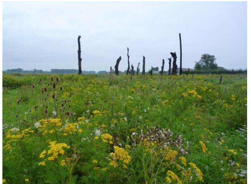
De eerste week van augustus verkenden we de boorden van de Maas net over de Nederlandse grens.