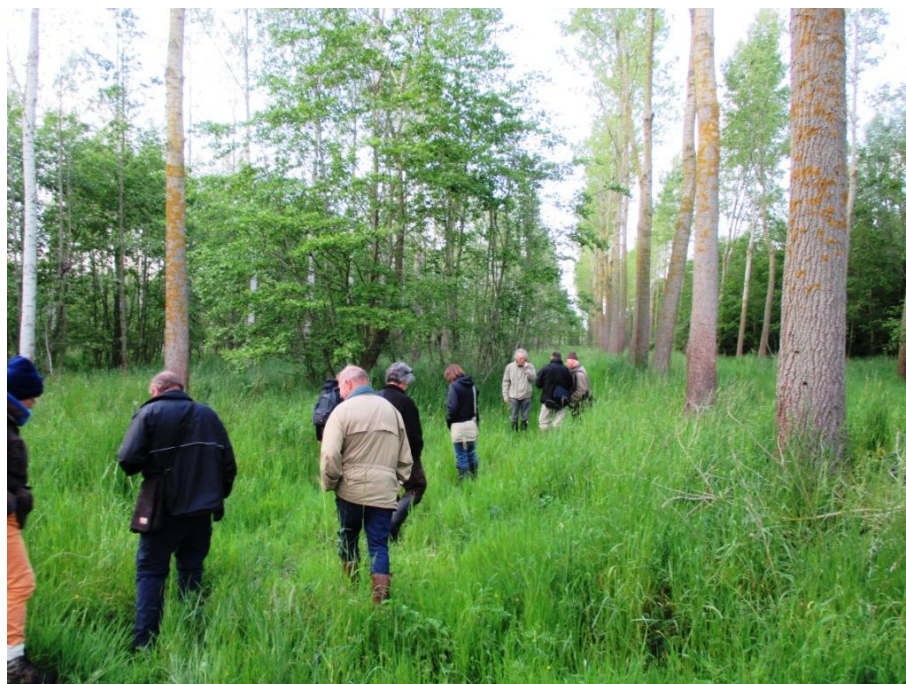
In de watering gingen we eens rondneuzen op blok 4.